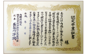
参加者の方には「愉氣マスター」認定証をお渡し致します。

・郵便振替：00250-1-131173【氣道協会】 ・ゆうちょ銀行：〇二八店（普）6495060【氣道協会】